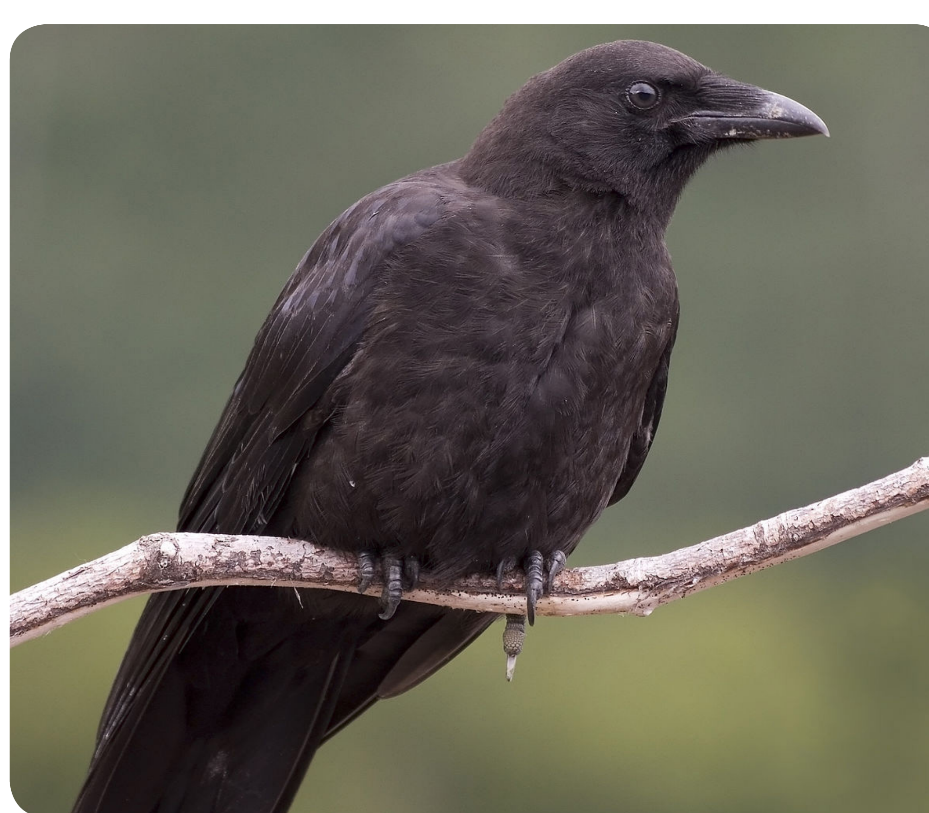
Etude des signatures acoustiques (ex: individuelle) du corbeau freux et des fonctions biologiques associées (ex: reconnaissance du partenaire).