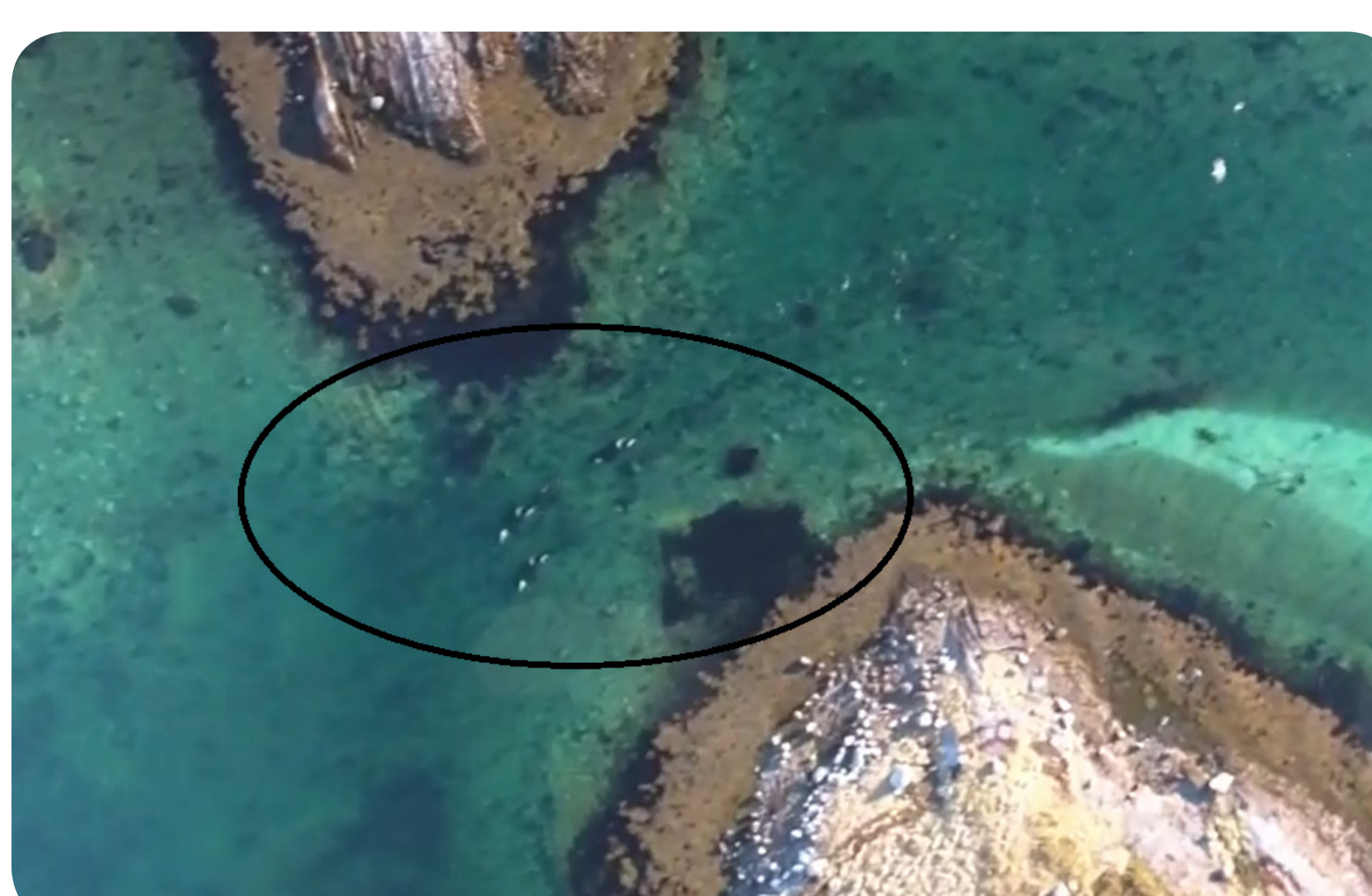
Opération de sauvetage d'orques bloquées dans une baie, à l'aide d'un dispositif de diffusion de sons attractifs.