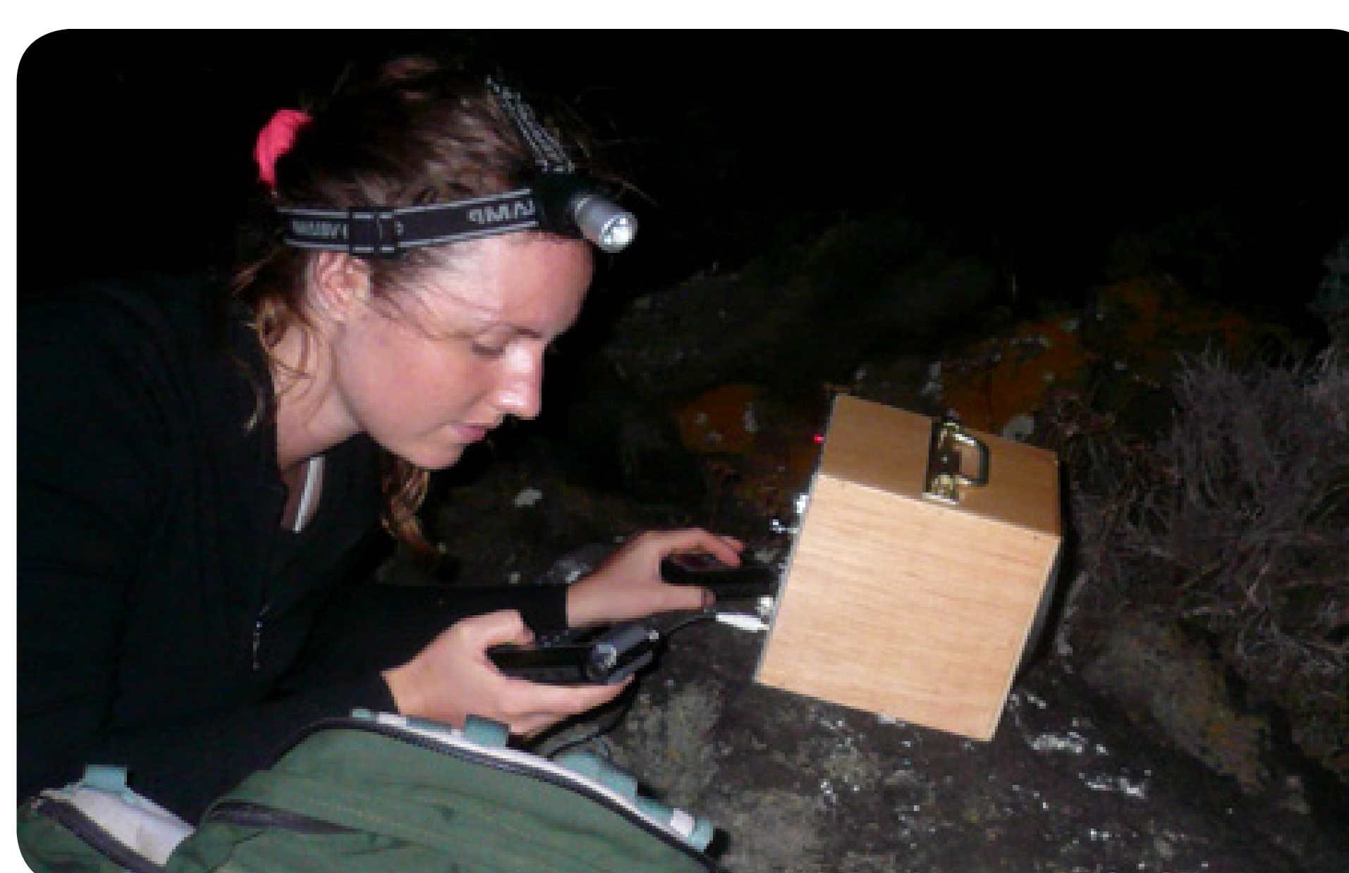
Développement de méthodes d'effarouchement acoustique (par exemple, chez certaines espèces d'oiseaux, le Loup gris, etc.)

Délocaliser certaines populations animales par la mise en place de techniques de repasse ( playbacks ) de signaux sonores naturels « attractifs » ou « répulsifs ». Ces techniques peu coûteuses et non invasives remplacent les méthodes classiques souvent difficiles à mettre en œuvre.