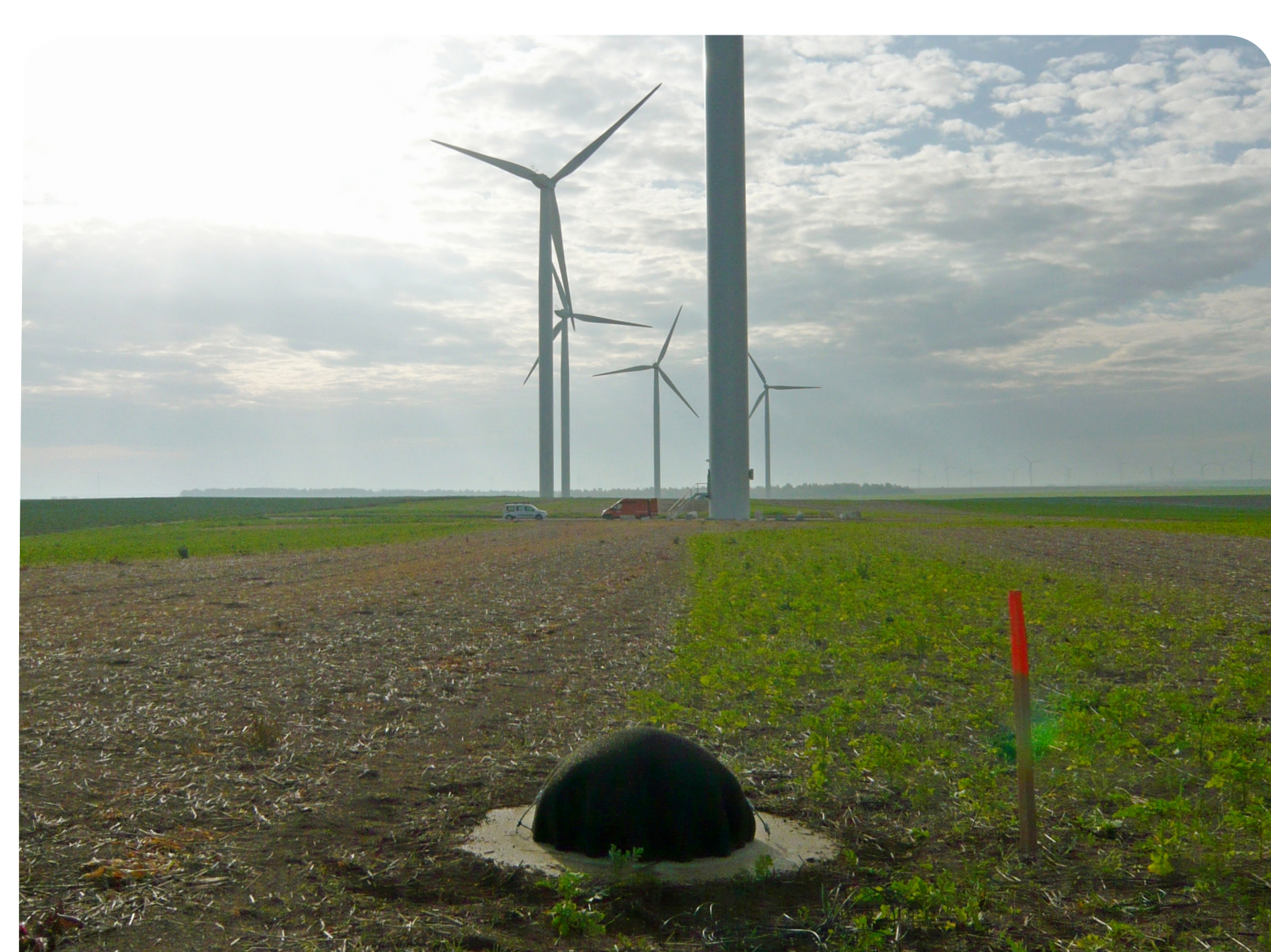
Mesure de la puissance acoustique d'une éolienne

La caractérisation expérimentale et la prévision numérique de ces phénomènes physiques sont indispensables pour appréhender correctement les risques de gêne sonore que pourrait entraîner un parc éolien.