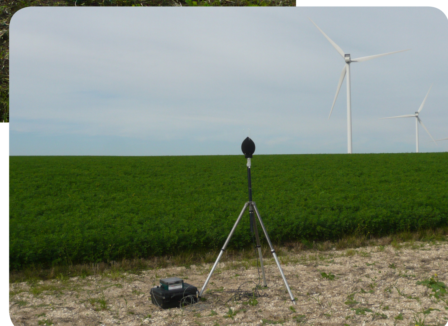
Mesure des niveaux sonores générés par un parc éolien

L'UMRAE aborde l'étude du bruit des parcs éoliens au travers de différentes approches, à la fois expérimentale, numérique et statistique :