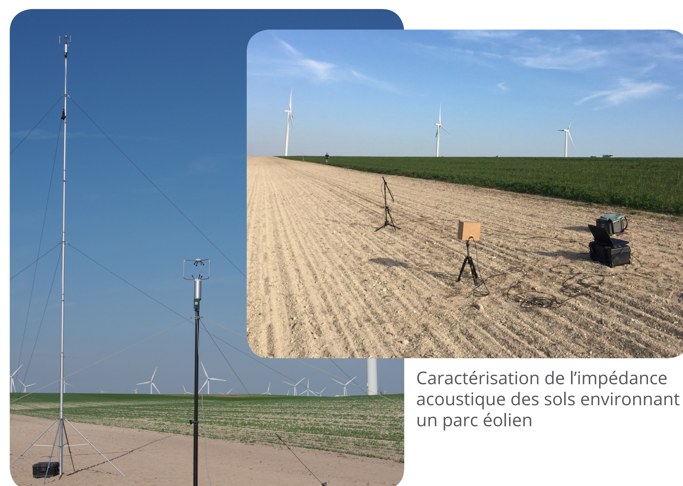
Relevés des vitesses, directions et turbulences du vent à l'aide d'anémomètres à ultrasons 3D